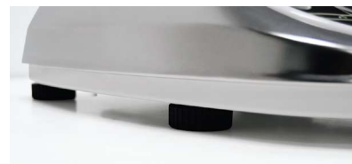
Pie regulable | Pied réglable | Adjustable feet