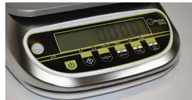
Teclado | Clavier | Keypad